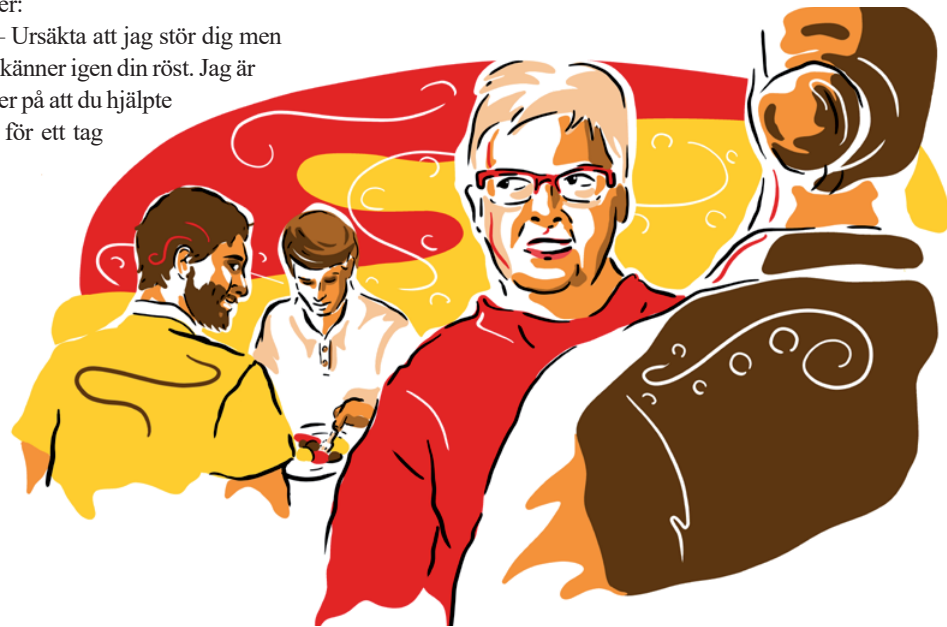
Illustration: Simon Leijnse

Jag tackade och log ännu mer och blev så varm. I vårt arbete har vi bara en röst. Plötsligt så fick jag ett ansikte också. Det blev ett starkt möte jag aldrig glömmer.