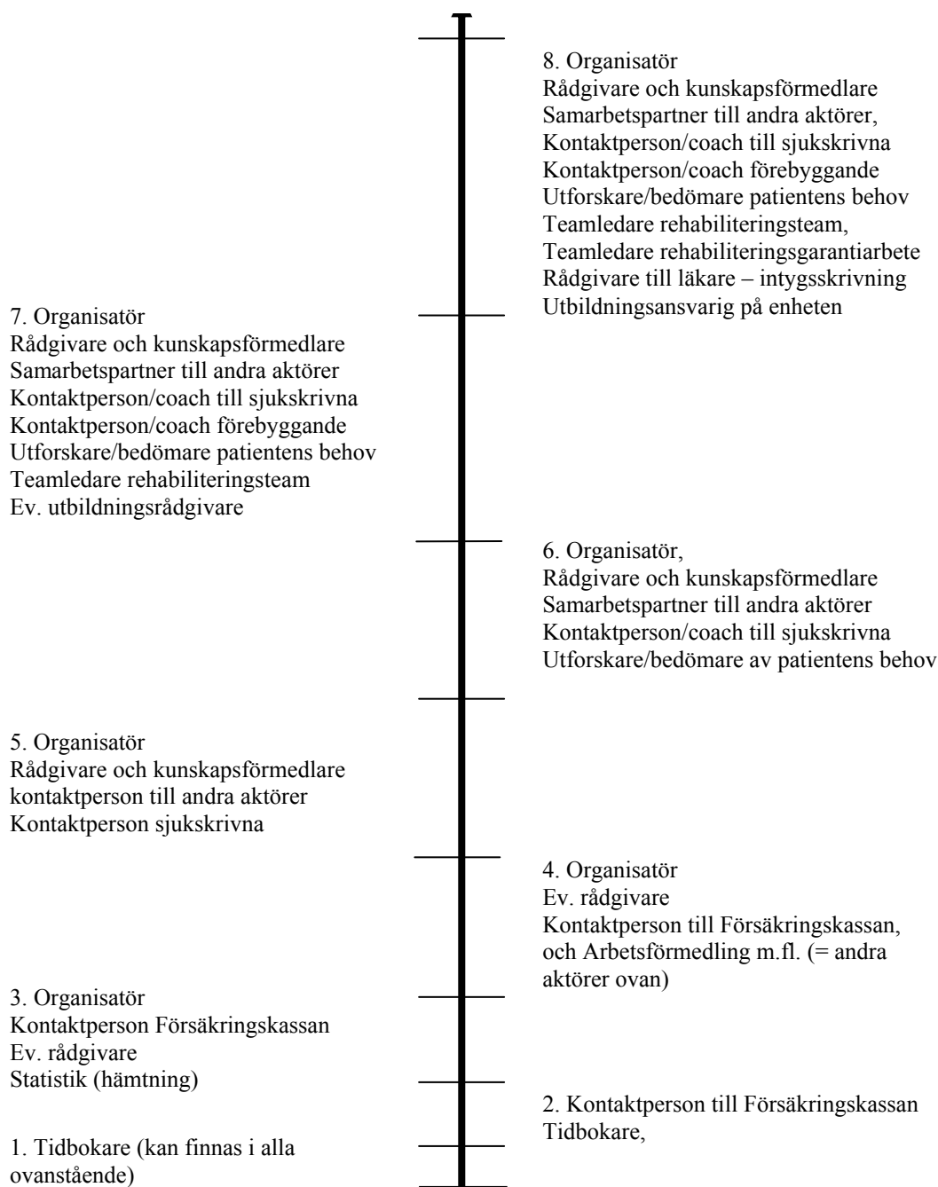
Figur 1. Beskrivning av arbetsuppgifter som vanligen ingår i koordinatorsuppdraget enligt enkäter och intervjuer med koordinators.

Det andra sättet att redovisa vilka uppgifter som utförs är att använda de beskrivningar av arbetsuppgifterna som framkommit i intervjuerna. I figur 1 beskrivs uppgifterna som ett kontinuum, eller en stega, där i ena änden finns de koordinators som endast arbetar med tidbokning, till andra änden där koordinators arbetar med hela spektret av arbetsuppgifter som utkristalliserats. Ett mindre antal koordinators har den översta respektive nedersta grupperingen av arbetsuppgifter. Efter figuren följer kortfattade beskrivningar av de olika uppdragen/arbetsuppgifterna.